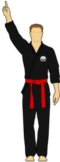
Schéma 7a : « Combattant vert touche la cible A, 1 point »