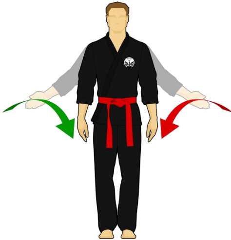
Schéma 3 : « Combattez »