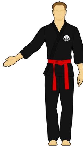
Schéma 10 : « Sortie de l'arène non intentionnelle » Le combattant vert est sorti de l'arène de combat en mettant les deux pieds dehors de façon non intentionnelle (bousculade).