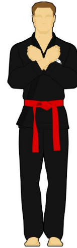
Schéma 4 : « Abstention », indécision de l'arbitre. Il n'a pas vu la faute ou la touche