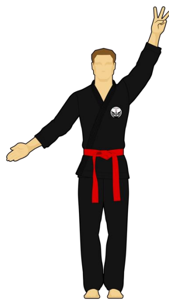
Schéma 12 : « Sortie de l'arène » Le combattant vert est sorti de l'arène de combat en mettant les deux pieds dehors de façon intentionnelle. Les points reviennent au Combattant rouge.