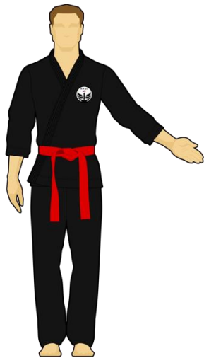
Schéma 9 : « Sortie de l'arène non intentionnelle » Le combattant rouge est sorti de l'arène de combat en mettant les deux pieds dehors de façon non intentionnelle (bousculade).