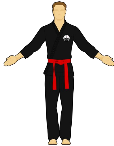
Schéma 2 : « Êtes-vous prêt ? »