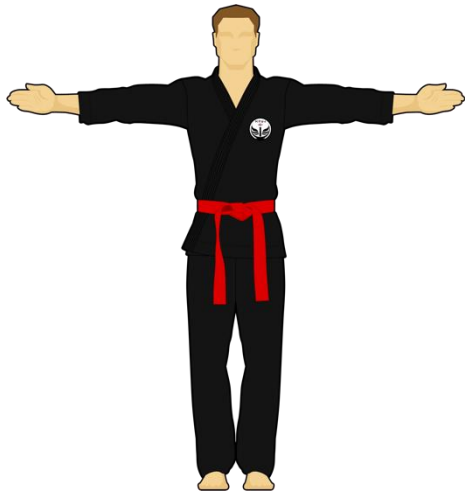
Schéma 1 : « Saluez-vous » ou « En Garde » ou « Saluez les arbitres »