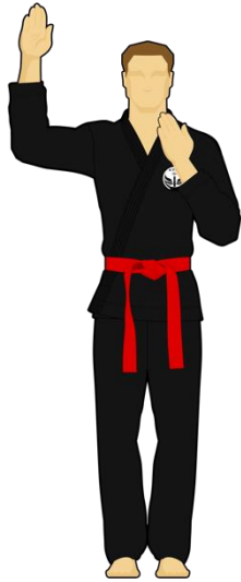
Schéma 13 : « Faute ! »

Le combattant vert vient de faire une faute passible d'un avertissement ou d'une sanction.