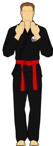
Schéma 5 : « Faute technique »