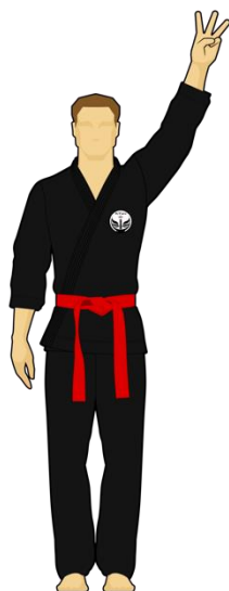
Schéma 8b : « Combattant rouge touche la cible B, 3 points »