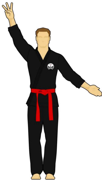
Schéma 11 : « Sortie de l'arène » Le combattant rouge est sorti de l'arène de combat en mettant les deux pieds dehors de façon intentionnelle. Les points reviennent au Combattant vert.