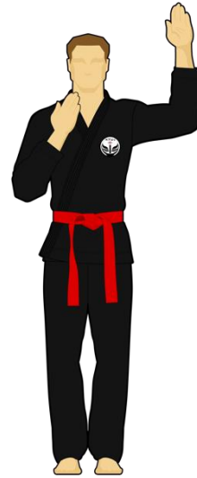
Schéma 14 : « Faute ! »

Le combattant vert vient de faire une faute passible d'un avertissement ou d'une sanction.