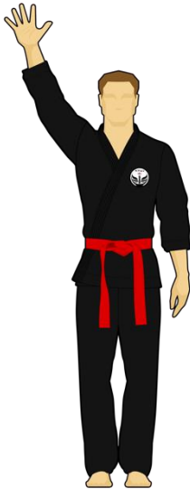
Schéma 7c : « Combattant vert touche la cible C, 5 points »