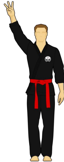
Schéma 7b : « Combattant vert touche la cible B, 3 points »