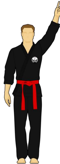
Schéma 8a : « Combattant rouge touche la cible A, 1 point »