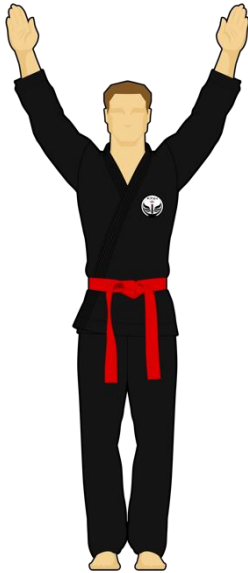
Schéma 15 : « Cessez ! »

Le combattant rouge vient de faire une faute passible d'un avertissement ou d'une sanction.